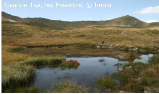
Grande Tsa, les Essertze