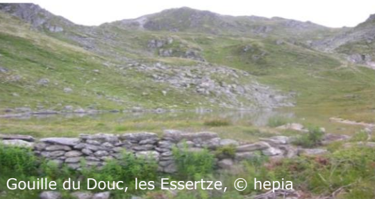
Gouille du Douc, les Essertze