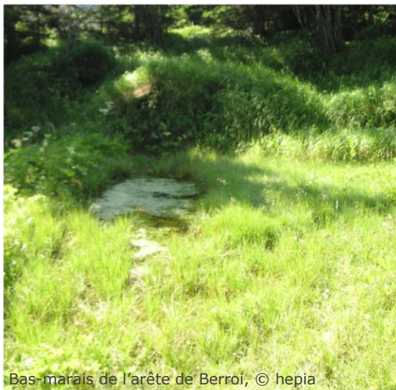
Bas-marais de l'arête de Berroi