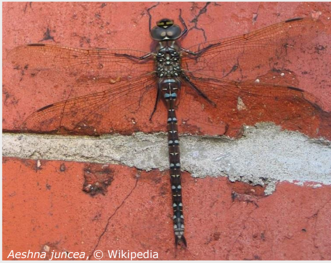
Aeshna juncea, © Wikipedia