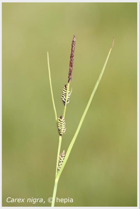
Carex nigra